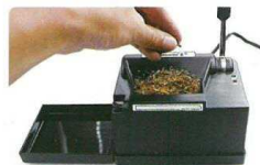
2. zvednutím páky otevřete komoru pro tabák, nasypete tabák ( max.1g). Komoru nepřepilujte