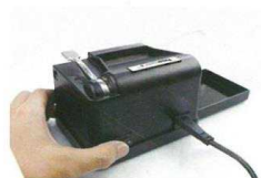
1. plničku zapojte a zapněte