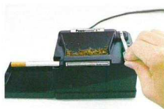
5. zavřete plnicí komoru pákou, dutinka se naplní