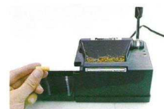
4. nasadíte dutinku na hrot