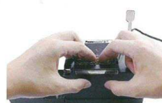
3. tabák lehce stlačte