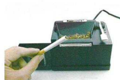
6. odeberte hotovou cigaretu