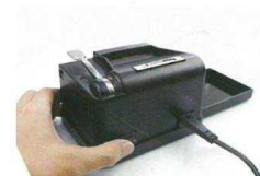
1. plničku zapojte a zapněte

Fortis-DB, spol. s r.o., Úněšovská 2205/17, Plzeň, www.fortisdb.cz