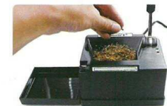
2. zvednutím páky otevřete komoru pro tabák, nasypete tabák ( max.1g). Komoru nepřepilujte