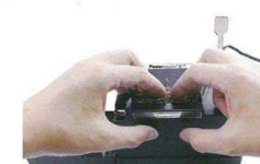
3. tabák lehce stlačte