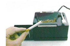
6. odeberte hotovou cigaretu