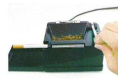
5. zavřete plnicí komoru pákou, dutinka se naplní