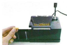
4. nasadíte dutinku na hrot